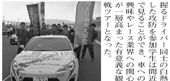
モータースポーツ科が参戦している、GAZOO RACING主催の86/BRZレーシング

モータースポーツ科が参戦している、GAZOO RACING主催の86/BRZレーシングが富士スピードウェイにて9月27日に行われ、応援観戦ツアーを実施した。 当日の富士スピードウェイでは秋のワンメイクレース祭りとして86/BRZレーシングの様々なジャンルのワンメイクレースやドリフトのイベントが開催されており、1日を通して、非常に見応えのある日であった。