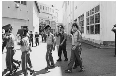
授業中の「地震と火災」を想定した避難訓練

授業中の「地震と火災」を想定した避難訓練が9月4日、実施された。 事前に避難経路や一次避難の重要性などをしっかりと説明してからの実施であった。学生は、教