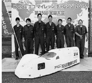
Honda Eco Mileage Challenge 2015 第35回全国大会

1リットルのガソリンでどれだけ走れるかを競う「Honda Ecoマイレージチャレンジ2015」第35回全国大会が、9月19日と20日に栃木県のツインリンクもてぎで行われ、大学・短大・高専・専門学校クラスにあたるグループIIIには85チームがエントリーし、9位の記録を残した。 卒業生で結成したOBチームは、本戦当日は前日の不具合を細かく調整し、メンバー全員チームワークよく動いたことでレース内容としては安定していた。ドライバーは今回が公式戦3度目の搭乗となり、落ち着いた姿勢でピットクルーの指示に は、二輪車クラスで昨年に引き続き優勝を果たし、3連覇を達成した。 1日目の公式練習走行、2日目の本戦共に天候に恵まれ最高のコンディションの中、各チームごとにマシンの調整が行われた。本校のマシンは軽量化にこだわり、今までのデータを基に改良を重ねながら細部まで燃費にこだわった一台である。 本戦当日は前日の不具合を細かく調整し、メンバー全員チームワークよく動いたことでレース内容としては安定していた。ドライバーは今回が公式戦3度目の搭乗となり、落ち着いた姿勢でピットクルーの指示に