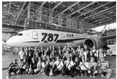
スポーツフェスティバル2015

なセッティングを出している姿やコース上で汗を流すドライバーの熱い視線が、周囲の観客を魅了している。現役の整備士の実力を発揮し、万全の状態に仕上げたマシンは終始安定した走りを見せ、今年度は3連覇をかけた戦いとなった。現役の整備士の実力を発揮し、万全の状態に仕上げたマシンは終始安定した走りを見せ、今年度は3連覇をかけた戦いとなった。